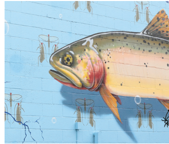
18. DAN TORO