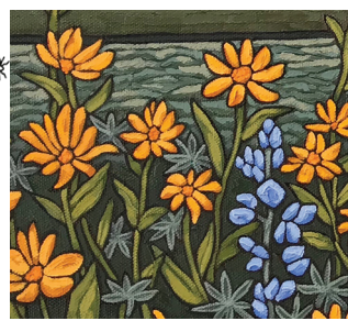
20. ANIKA YOUCHA