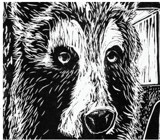
17. CARA O'CONNOR

Aunque se ve genial bajo un microscopio, un crecimiento excesivo de este organismo puede dañar los ecosistemas acuáticos.