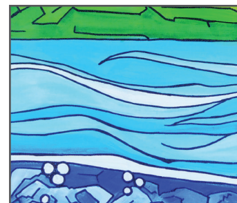
9 MAE ORM Wind, Earth, Water!

Q: What kind of human-caused pollution is threatening our clean water supply? ¿Qué tipo de contaminación causada por el hombre amenaza nuestro suministro de agua limpia?