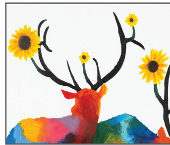
2 JH HIGH SCHOOL STUDENTS Wild Wapiti

Q: "Wapiti" is another name for what animal? ¿"Wapiti" es otro nombre para qué animal?