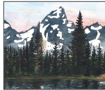
7 JULIA BRADY The Little Architects Landing

Q: What nickname is often used for beavers? ¿Qué apodo se usa a menudo para los castores?