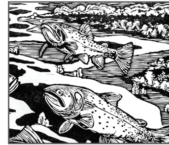
11 AVA REYNOLDS Spread to Snake

Q: Name this important tributary of the Snake River. Nombre este importante afluente del río Snake.