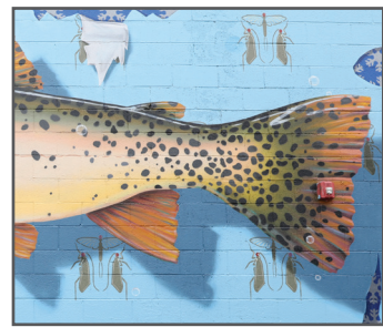
5 DAN TORO Hooked (2020)

Q: What kind of trout is native to the Snake River? ¿Qué tipo de trucha es nativa del río Snake?