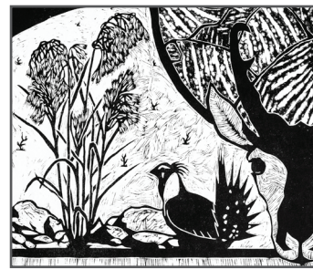
6 SUSAN GRINELS Cheating Cheatgrass

Q: What device is The Nature Conservancy using to slow the growth of cheatgrass? ¿Qué dispositivo está usando TNC para frenar el crecimiento de cheatgrass?