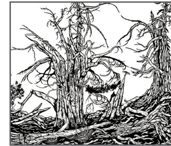
13 JOSH WINKLER Pine on the Edge

Q: What type of tree is found at the highest elevations in the Tetons? ¿Qué tipo de árbol se encuentra en las elevaciones más altas de los Tetons?