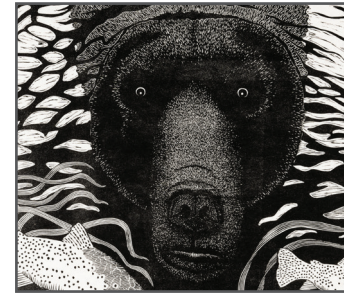
12 BEN ROTH Protect Our Water, Damn It!

Q: How many aquatic insects are hidden in the river? ¿Cuántos insectos acuáticos hay escondidos en el río?