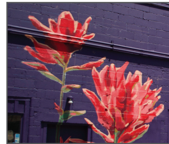
8 KATY ANN FOX the time in place (2021)

Q: How many different native wildflower species do you see? Name one. ¿Cuántas especies diferentes de flores silvestres nativas ves? Nombra una.