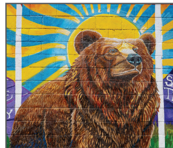
10 HELEN SEAY Knowledge is Protection

Q: Name two ways to keep bears safe when hiking in bear country. Mencione dos formas de mantener a los osos a salvo cuando caminan en el territorio de los osos.