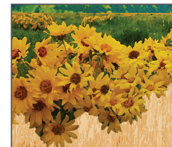
16 SUSAN MARSH Field of Dreams

Q: Tracking has shown this mammal traveling over 45 miles and 2k vertical feet in 4 days to winter range. Name it. El seguimiento ha demostrado que este mamífero viaja más de 45 millas y 2k pies verticales en 4 días hasta el rango de invierno. Nómbralo.