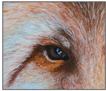
3 NATALIE CONNELL Intent

Q: What animal is trying to catch your attention for Wildlife Tourism for Tomorrow? ¿Qué animal está tratando de llamar tu atención?