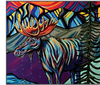
15 NICOLETTE MAW Backyard

Q: Where does the water come from that refills our aquifer? ¿De dónde viene el agua que recarga nuestro acuífero?